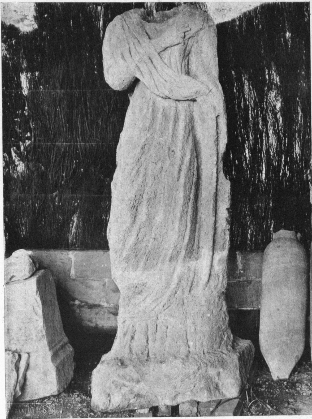
Estàtua femenina de pedra policromada. 1'65 ctns. alt.

Passada l'invasió el lloc ocupat per les esmentades viles degué quedar un cert temps abandonat i després el lloc fou tornat a utilitzar com a cementiri cristià, acabant de destruir la major part de les edificacions que encara restaven en peu, aixecant-ne d'altres, aprofitant bon nombre de materials existents, ja en la mateixa forma en què es trobaven, ja adap-