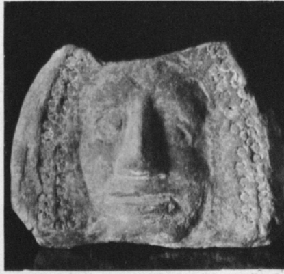
Antefix de pedra. — 0'25 ctm. alt.