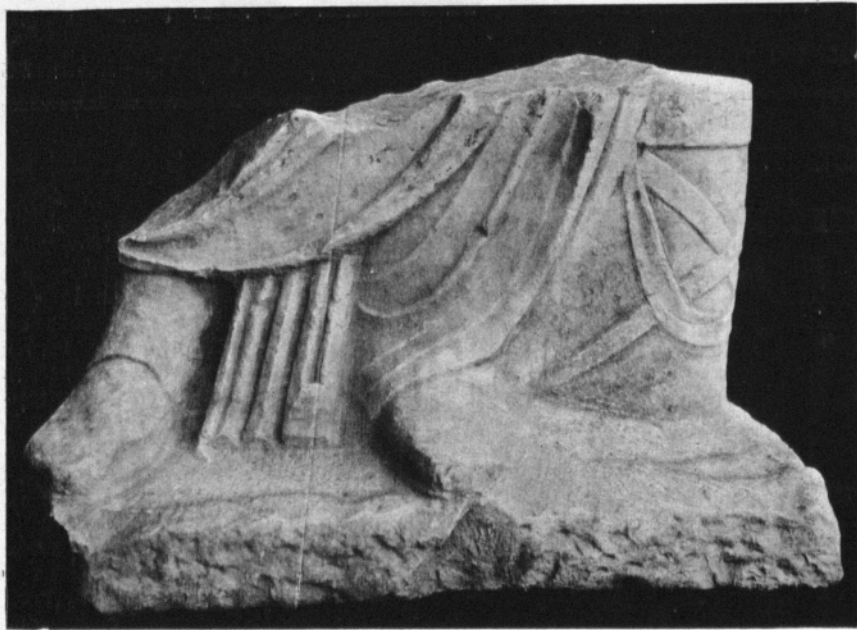
Part inferior d'una estàtua masculina de marbre blanc. Tamany natural.

Tenim en primer lloc dues estàtues femenines de pedra del país trobades jaient per terra, darrera de la més gran de les sales amb columnes. A totes dues els hi falta el cap que no pogué ésser retrobat. Són de factura bastant grollera, van drapades amb palla i stolla , els plecs de la roba sens ésser descuidats, ens donen el tipus comú de l'estatuària provincial romana. L'actitud és més aviat disgraciosa i les proporcions no massa bones. Les dues havien estat estucades i policromades conservant-se especialment en una d'elles restes ben visibles de pintura. En aquesta, de més del cap li falta el braç dret i la mà esquerra, l'altra té l'avant braç dret creuat damunt del pit, tenint la mà corresponent dos dits extensos i dos doblegats, i la mà esquerra està amagada per un cap del mantell que li creua el pit en sentit diagonal.