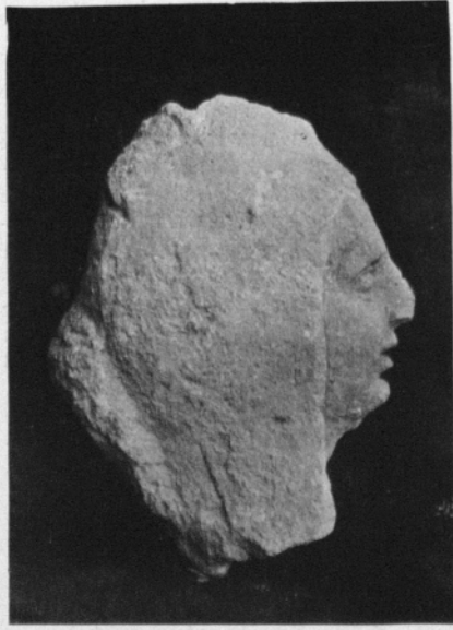
Testa de pedra. — 0,30 ctm. alt.