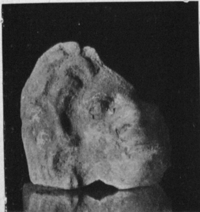
Antefix de pedra. — 0'25 ctm. alt.

Antefix representant una màscara tràgica, és de pedra del país, la cara té la falta d'expressió que sol ésser comuna a aquestes representacions, un dels ulls està més amunt que l'altra.