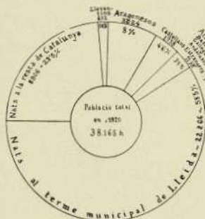
Fig. 1 — Gràfic de la composició de la població de Lleida.

Segons el cens de 1900, Lleida tenia 21.432 habitants; en el de 1910, figurava amb 24.531; en el de 1920 es comptaren 38.155 pobladors. Ara bé entre la data d'aquests dos censos darrers van