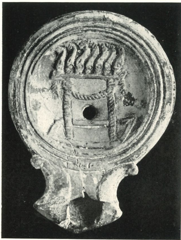
Llanta del Museu de Barcelona, amb la representació d'un marcador de circ constituït per set dofins damunt d'un edicle de dues columnes.