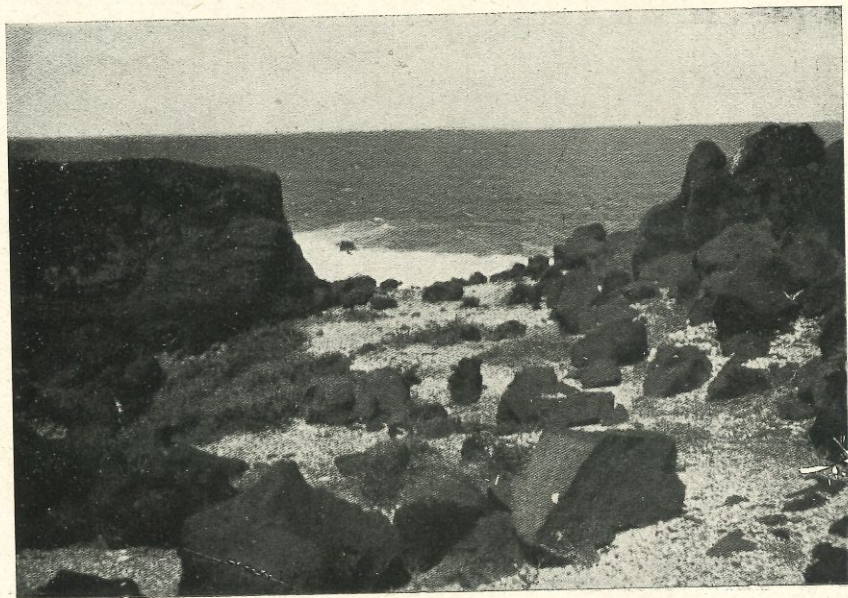
Fig. 4.—Teno. Vista de otro conchero inmediato a la «Cueva del Tabaco»