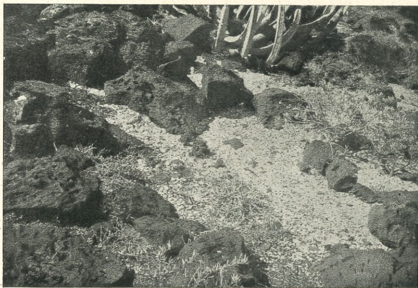
Fig. 2.—Teno. Círculo de piedras que suele hallarse en los concheros, dispuestas como asientos