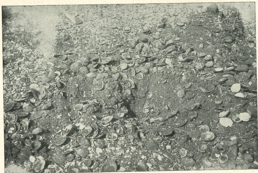
Fig. 3.—Teno. Remoción de un conchero que muestra las lapas y la tierra negra que las envuelve