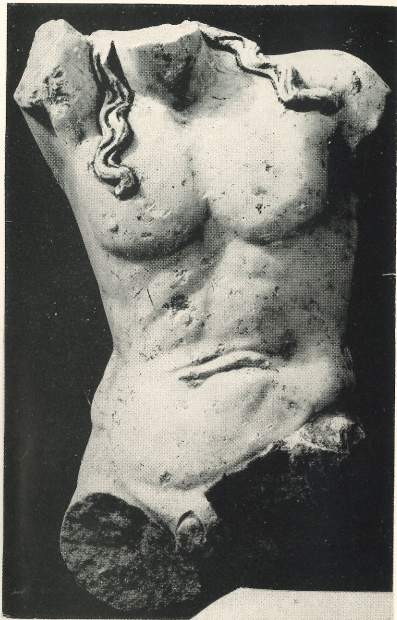
Fig. 1.—Barcelona: Fragment d'estàtua de marbre de Dionysos (Museu d' Història de la Ciutat).