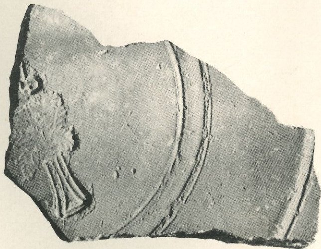
Fig. 4.—Barcelona: Fragment de pàtera amb l'estampació d'un arbre (Museu d'Història de la Ciutat). (nida una mica superior al natural.)