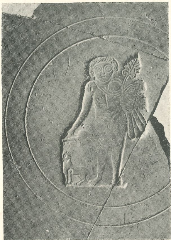
Fig. 2.—Barcelona: Pàtera amb la representació de Dionysos (Museu d'Història de la Ciutat). (nida una mica inferior al natural).