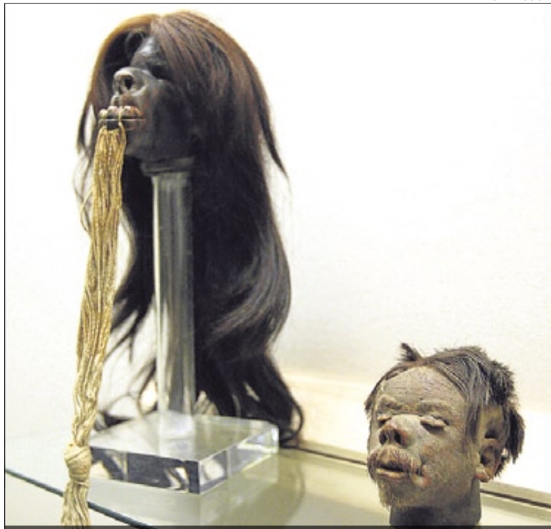
Un cap reduït procedent de la col·lecció de l'Etnològic.